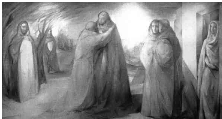
Setkání dvou světců Dominika a Františka z Assisi v Římě v roce 1221

Machourek se nemohl v roce 1990 vrátit do ČSR pro zhoubnou svou chorobu. Zemřel 22. listopadu 1991, uložen byl nejprve do hrobu své matky na Olšanských hřbitovech v Praze a v roce 2000 spolu s ostatky své matky pohřben v Kroměříži blízko rodiště.