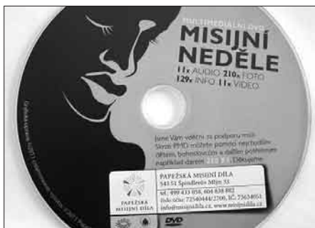
Multimediální DVD – Misijní neděle (11x VIDEO, 11x AUDIO, 210x FOTO a 129x INFO souborů).

Český rozhlas 2 uvede v neděli 20. října v 9 hod. přímý přenos slavnostní mše svaté z kostela sv. Bartoloměje v Pardubicích. Hlavním celebrantem bude P. Jiří Šlégr.