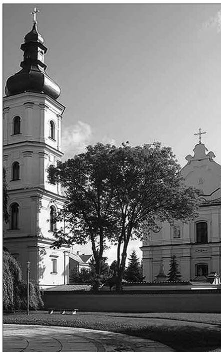
Katedrála v Pinsku

Po druhé světové válce byla malá západní část diecéze, celkem 36 farností, přičleněna k Polsku a nyní je zde samostatná diecéze Drohiczyn. Naprostá většina území však připadla Běloruské sovětské socialistické republice, tedy SSSR. Jestliže v roce 1939 měla diecéze 172 farností, ze 136 v Bělorusku jich zůstalo v období socialismu jen několik. V roce 1984 zde bylo dvanáct obsazených farností a do pěti kněz dojížděl. Všude jinde byly kostely uzavřeny nebo zbořeny.