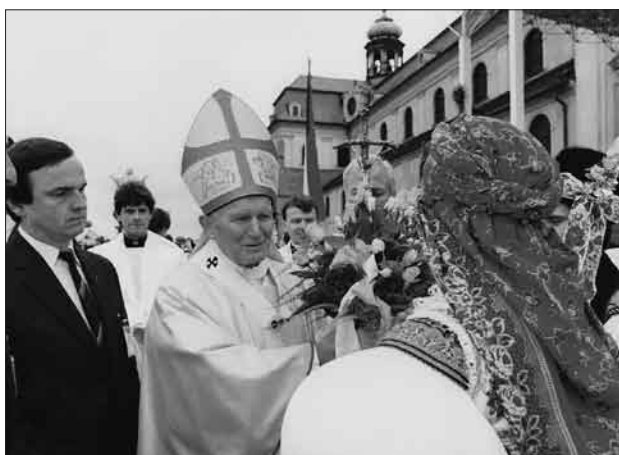
Papež Jan Pavel II. na Velehradě v roce 1990