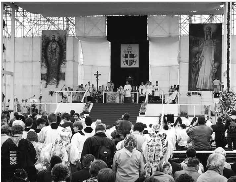
Papež Jan Pavel II. v Olomouci v roce 1995