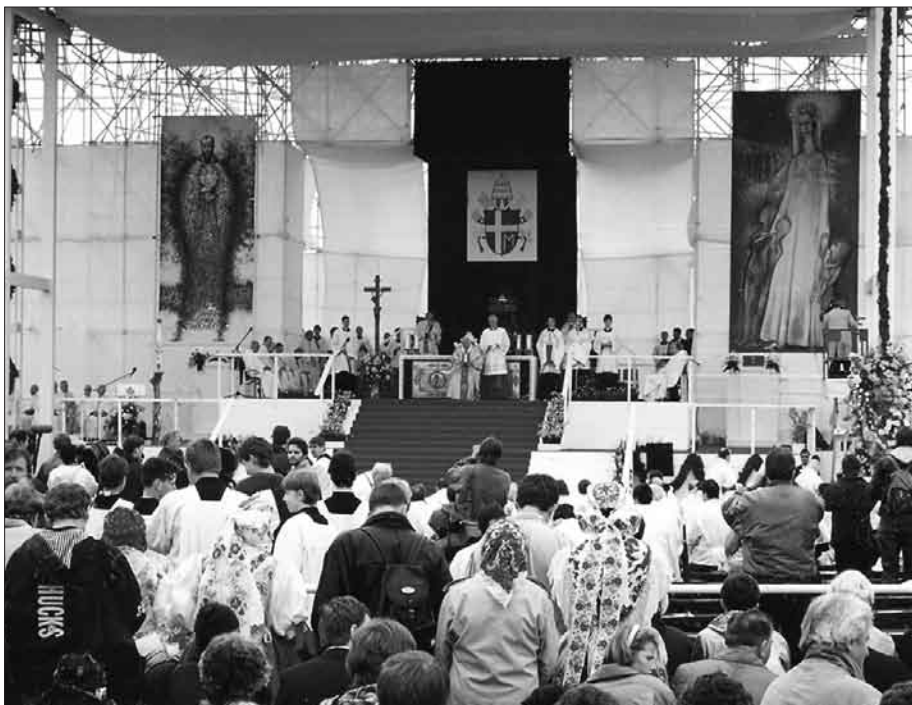
Papež Jan Pavel II. v Olomouci v roce 1995