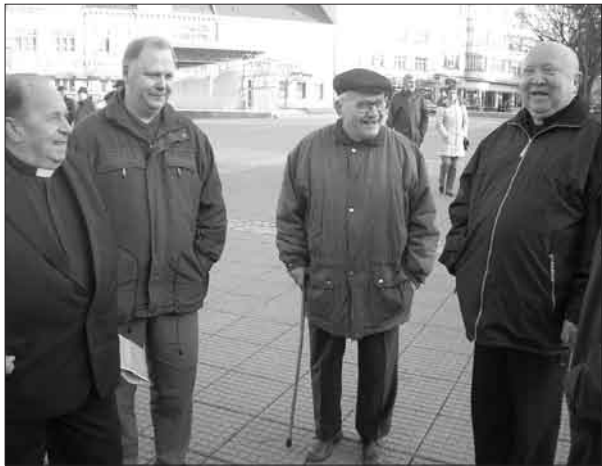
> Z E u w u o e u 8 „ ~ a E, q q o u E q . t . q < ~ E E a { E ~ : l q ~ E . t y ; y E u a , o e a , E ~ q t E t u } t E q l y k ~ u j l a AG > t y . E q t t B @ E c ~ 3 u Z E u w q l q